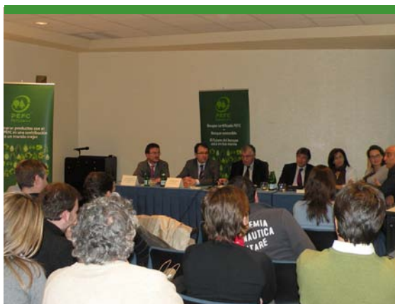
Jornada técnica celebrada en Sevilla

En las jornadas técnicas de sensibilización se analizó la importancia de incorporar la eco-innovación en las empresas del sector forestal, los métodos de implantación de la certificación forestal y la cadena de custodia, el impacto de la nueva legislación ambiental, la compra pública verde y las políticas de responsabilidad social corporativa. Se realizaron un total de 7 ediciones en distintas ciudades y en ellas participaron 265 destinatarios.