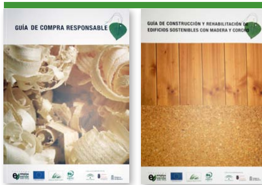
Portadas de las guías sobre compra responsable y sobre construcción y rehabilitación de edificios sostenibles con madera y corcho

Por último la guía sobre construcción y rehabilitación de edificios sostenibles con madera y corcho muestra los pasos necesarios para la implantación de la certificación PEFC a fabricantes de muebles, puertas, ventanas, tarimas, estructuras y elementos decorativos de madera u otros productos forestales.