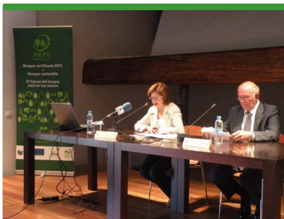
Jornada técnica celebrada en Valencia

Difusión. Tanto la celebración de las jornadas como los diferentes materiales editados, la página web del proyecto y el observatorio han contribuido a informar y sensibilizar a un elevado número de trabajadores acerca de la importancia de llevar a cabo una gestión sostenible de los bosques.