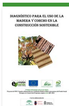
Portada del diagnóstico para el uso de madera y corcho en la construcción sostenible

En cuanto a los estudios, el diagnóstico para el uso de madera y corcho en la construcción sostenible analiza el contexto económico, social y ambiental de la construcción sostenible y las iniciativas de carácter público y privado en relación con la integración de la sostenibilidad en los edificios de nueva construcción y en la rehabilitación de viviendas. Además, se identifican las oportunidades de uso de materiales de origen forestal sostenible en la construcción y se recogen propuestas de mejora para impulsar el uso de la madera y el corcho en la construcción sostenible.