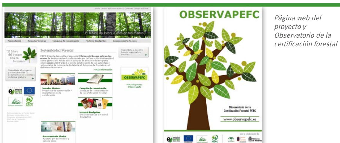
Página web del proyecto y Observatorio de la certificación forestal

Por último, se puso en marcha el Observatorio de la certificación forestal ( www.observapefc.es ). A través de esta herramienta se ofrece información sobre la gestión sostenible de los bosques, además de permitir el contacto y la creación de redes entre diversas entidades con políticas de responsabilidad social corporativa, potenciando así su compromiso con la sostenibilidad.