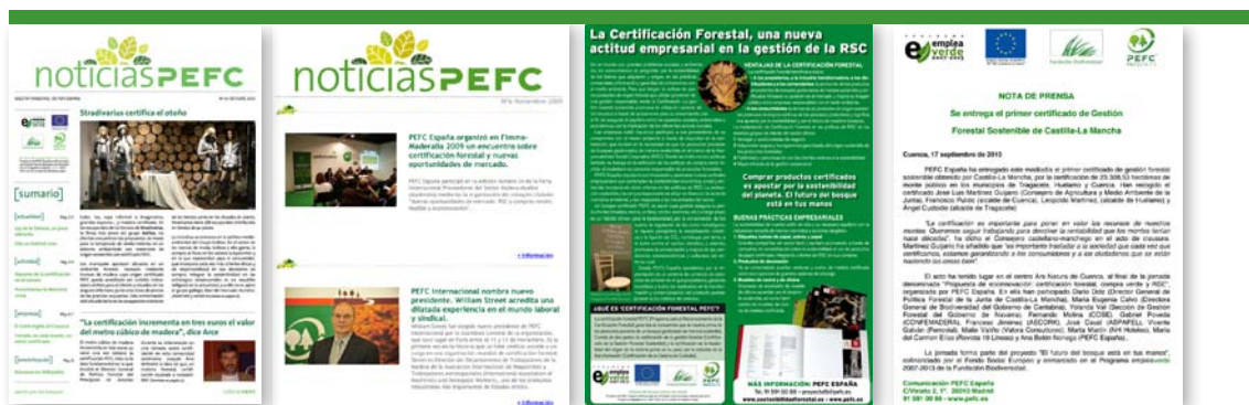
Boletines trimestrales, mensuales, publirreportajes y notas de prensa

En cuanto a los estudios, el diagnóstico para el uso de madera y corcho en la construcción sostenible analiza el contexto económico, social y ambiental de la construcción sostenible y las iniciativas de carácter público y privado en relación con la integración de la sostenibilidad en los edificios de nueva construcción y en la rehabilitación de viviendas. Además, se identifican las oportunidades de uso de materiales de origen forestal sostenible en la construcción y se recogen propuestas de mejora para impulsar el uso de la madera y el corcho en la construcción sostenible.