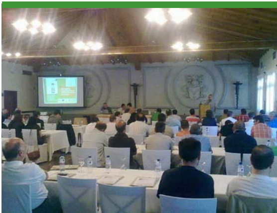
Jornada “La participación en medio ambiente en la empresa”

La campaña de información de buenas prácticas para la participación de los trabajadores en la mejora ambiental de la empresa ha incluido la difusión de las guías, así como la celebración de una jornada presencial de presentación de las mismas en Santiago de Compostela.