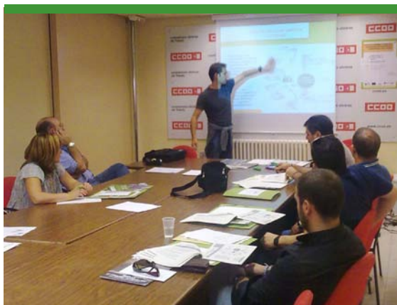
Curso “El acceso de los trabajadores a la información ambiental, clave para la participación en la sostenibilidad de los centros de trabajo”

El curso presencial “El acceso de los trabajadores a la información ambiental, clave para la participación en la sostenibilidad de los centros de trabajo”, del que se han celebrado 15 ediciones, ha dotado a trabajadores y sus representantes de los conocimientos básicos para iniciar su participación en la mejora de la gestión ambiental de las empresas.