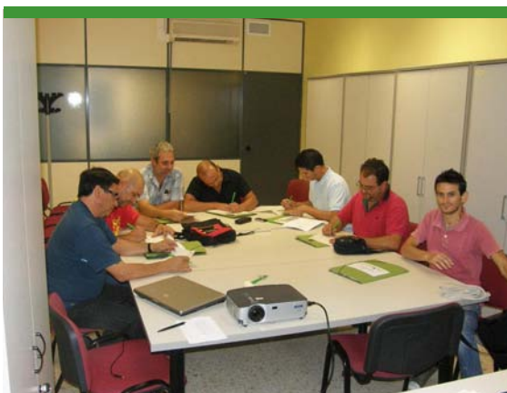
Curso “El acceso de los trabajadores a la información ambiental, clave para la participación en la sostenibilidad de los centros de trabajo”

Dentro del Programa empleaverde se consideran destinatarios prioritarios ciertos colectivos desfavorecidos como son: mujeres, discapacitados, inmigrantes, trabajadores mayores de 45 años y trabajadores de baja cualificación. También trabajadores de zonas deshabitadas, rurales, áreas protegidas y reservas de la biosfera y por último, trabajadores del sector ambiental.