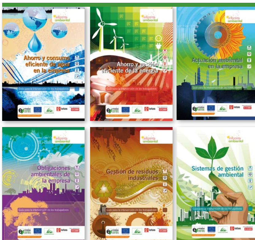
Portadas de las guías